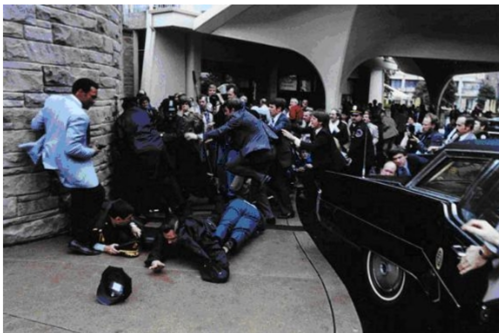
1981 年 3 月 30 日，里根遇刺

目睹了这一切沧桑巨变的里根总统，开始确信只有恢复金本位才能挽救美国经济。1981 年 1 月，里根上任伊始就要求国会成立“黄金委员会”（Gold Commission）研究恢复金本位的可行性。此举直接触犯了国际银行家的禁区，1981 年 3 月 30 日，入主白宫仅 69 天的里根就被一名叫辛克利的追星族一枪打中，子弹距心脏仅 1 毫米。据说此人这样做是为了吸引著名影星朱迪·福斯特的注意。当然，和绝大多数刺杀美国总统的凶手一样，此人被认为神经有问题。